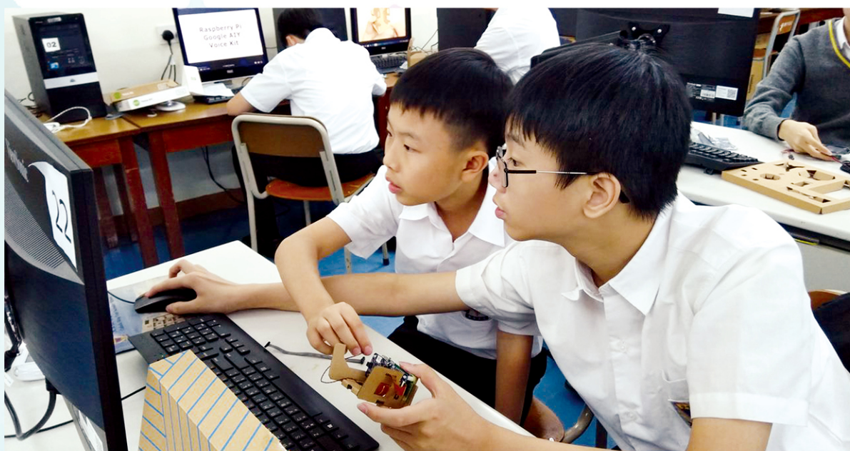
學生努力學習數碼編程。