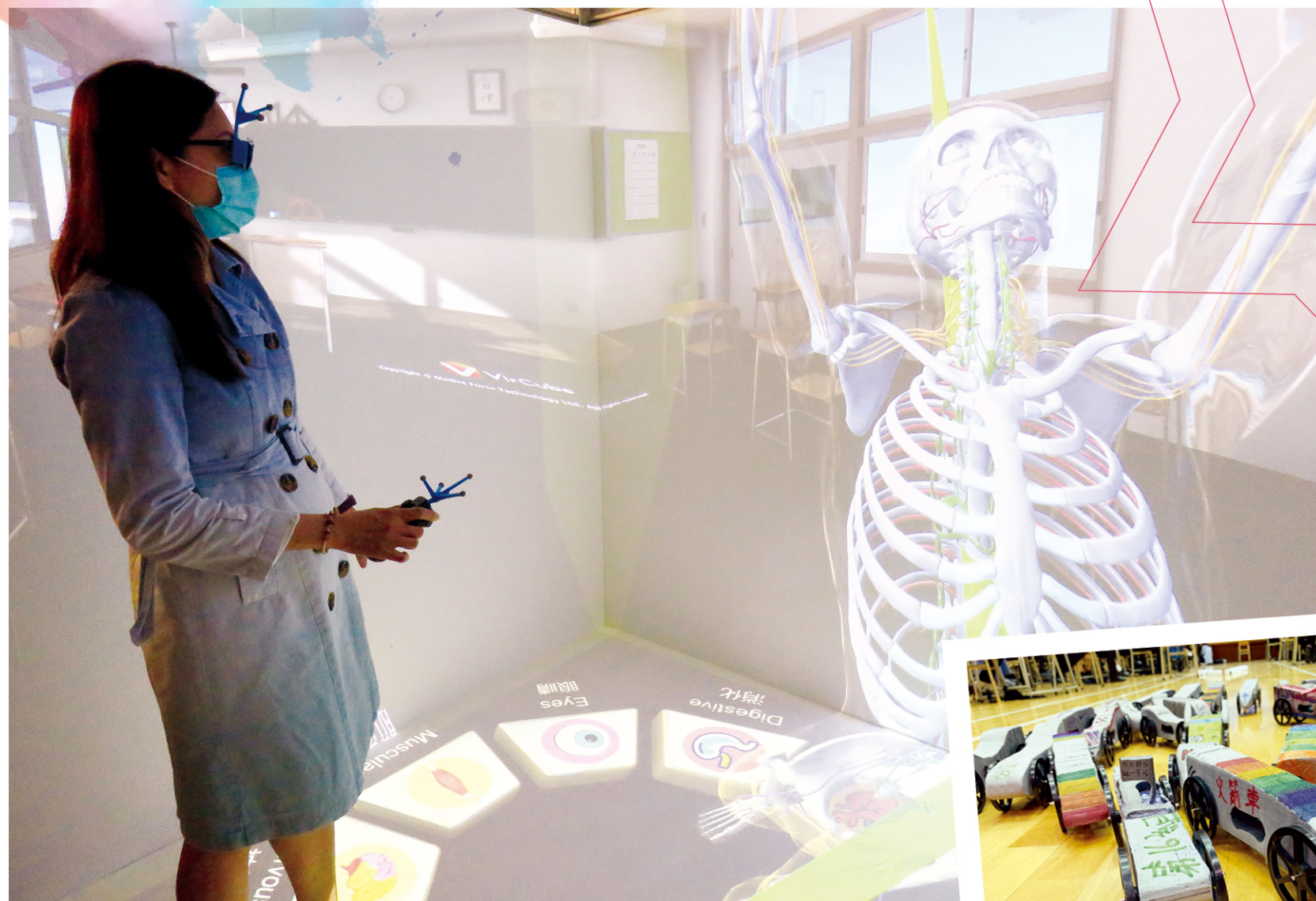
VR 科技令教學變得具體生動。

學校資訊科技組老師為全校師生提供電子學習培訓，負責老師會錄製短片教授師生如何使用電子教學工具進行學與教，如 Schoology、Google Classroom、Zoom 和 Microsoft Teams 等。老師運用有關教學軟件，隨時發放教學短片；老師又會推行翻轉教室策略，根據同學程度給予不同的教材，提升照顧學習差異的效能。教學短片的好處是可供學生重複觀看，幫助同學隨時隨地解決學習問題。老師在課餘時間亦會透過電子平台，對學生的提問即時回饋，提高其學習積極性。