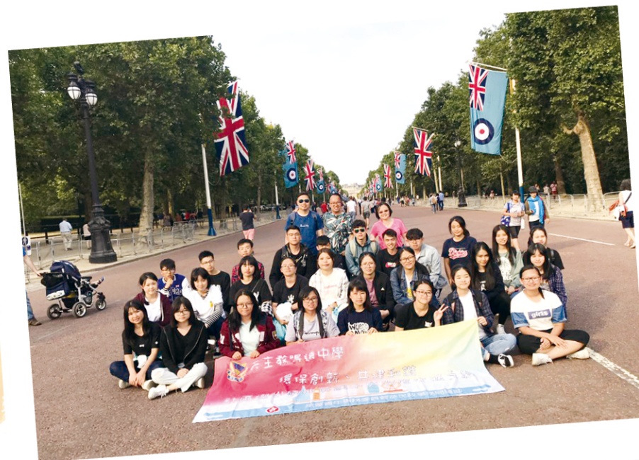
英國交流團令學生實地體驗外國文化。