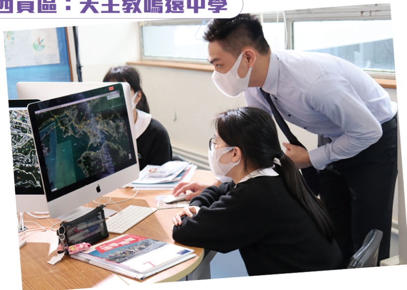
學生在地理資訊室 (GIS) 上課。