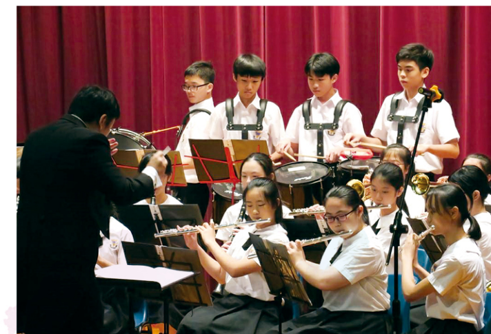
銀樂隊在校內外均有不少演出機會。

袁校長強調，申請優質教育基金（QEF）對學校幫助很大。2018 年政府推出公帑資助學校專項撥款計劃，鳴遠已善用其中 140 多萬撥款，改善教學設備，增加教學資源。老師亦會與非牟利團體、區議員辦事處等單位合作，又向西貢民政事務處申請額外資源，同時為學生提供服務學習的機會。「我們還參與了 Project We Can，該計劃資助學校建成了地理資訊室、推行機械人活動、編程計劃等等。」袁校長讚揚老師的付出，而師生上下一心，同學便會得到最好的培育。