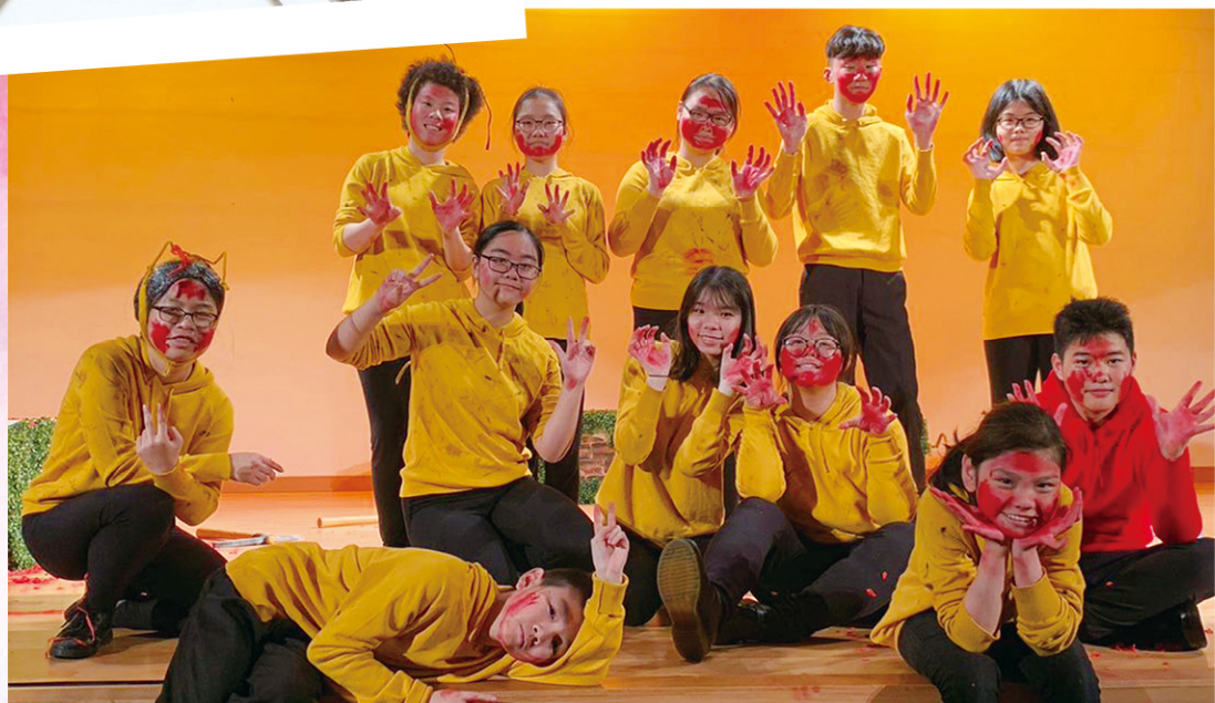
同學盡情投入話劇演出之中。

鳴遠共有 30 多項的課外活動，或動或靜。學校鼓勵初中同學參與一項制服團隊如紅十字會或海事青年團，提升學生的紀律和自信。同學又喜歡參與表演活動，很多同學參加了銀樂隊、話劇組和舞蹈組。學校會盡量提供表演及參加校際比賽的機會，藉此增加學生的自信。其中銀樂隊雖成立僅兩年，已獲學界多個獎項；話劇組同樣有傑出的成績，已兩次獲香港學校戲劇節挑選為公演學校；學校舞蹈組常獲邀在社區表演。