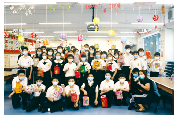
英文科燈謎活動促進同學思維能力。

中文科的教學策略為「以讀促寫」，讓學生透過閱讀，模仿文章結構來作文，提升閱讀能力之餘，亦加強其寫作能力。中文科又設計不同種類的語文活動，例如到灣仔「文學散步」，邊走邊閱讀小思女士關於灣仔的文章；又到中文大學參觀，並閱讀有關中文大學的散文。在中秋或元宵會有猜燈謎活動，提升其語文興趣。