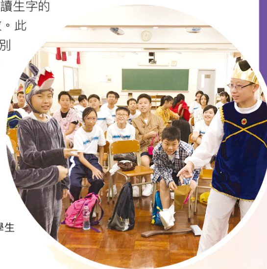
中一級透過話劇增強學生英語會話的信心。

無論是中文科還是英文科，均設有必讀書目。學校鼓勵同學多閱讀，擴大知識層面，加強語文能力；這使同學能輕鬆處理學習材料，應付公開考試。同學很希望進一步提升英語水平，要求更多的學習機會，由是外籍老師會在午膳時間舉行英語會話活動，師生亦會一同參與辯論比賽，這有助同學迅速提升生字量。為了讓學生有效準備公開試，英文科老師會特別整理歷年公開考試的生字，配上中文解釋和相關的二維碼，學生可隨時聽到外籍老師朗讀生字的發音，極為有效。此外，老師亦特別為新來港學童安排課後英語補習，照顧學習差異。