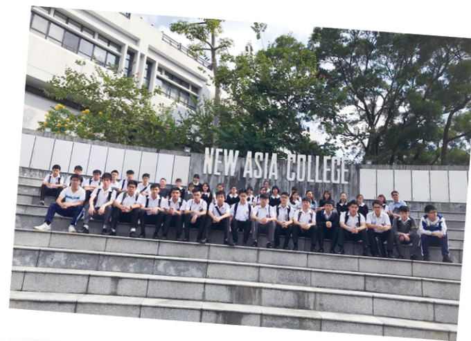
到中文大學進行「文學散步」，提升語文興趣。

鳴遠舉辦不少交流團讓不同年級同學到區外擴闊視野，認識世界，考察異地社會。這兩年同學到訪過蒙古國考察；到泰國進行義工服務；參與高鐵之旅，了解國內發展。同學到過印度孟買，從一帶一路中尋找機遇；也參與英國之旅，學習英語，參加外展訓練，了解當地文化。英國團內有六、七位同學首次乘飛機，對於學生來說是一次重要的學習機會，藉此增廣見聞，定立人生目標。