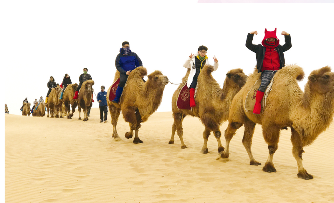
交流團體驗騎駱駝。